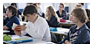
Programmes et ressources en philosophie - voie GT

Vous trouverez aussi sur cette page d'autres documents concernant les exercices, les épreuves et les nouveaux auteurs aux programmes des voies générale et technologique.